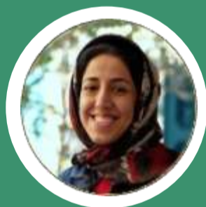
حدیث بگری کارشناس سئو و محتوا