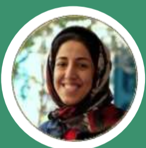
حدیث بگری کارشناس سئو و محتوا